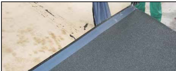
2. Incollare per autoadesione la membrana