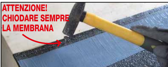
3. Chiodare la membrana sulla fascia priva di adesivo