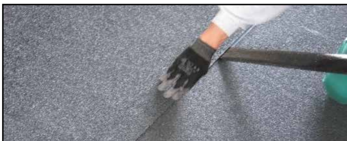
6. Asportare la fascia bisiliconata