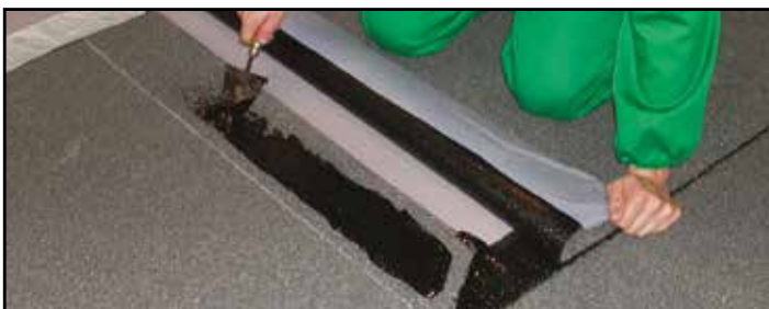
7. Saldare le sovrapposizioni di testa con HEADCOLL