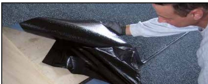
4. Posare la membrana successiva