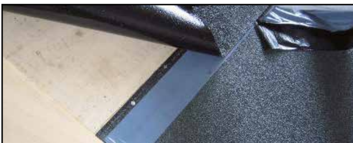
5. Ricoprire il sormonto