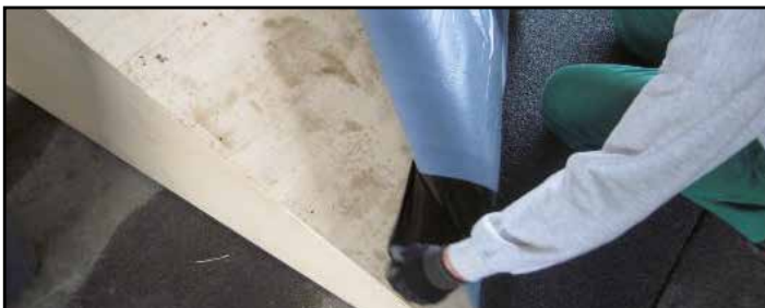
1. Togliere il film siliconato